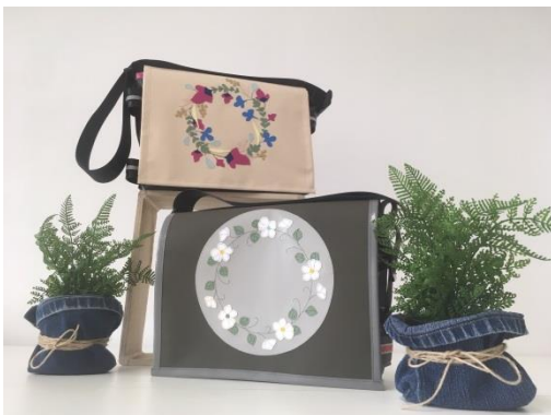
Bildhinweis: Individuelle Taschen-Designs im Stadtladen vom design shop in Liezen