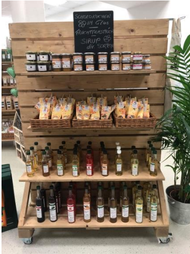
Bildhinweis: Selbstgemachte kulinarische Köstlichkeiten im Stadtladen in Liezen