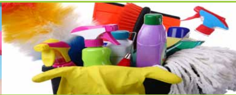
Textil- und Hausservice Arbeitstraining