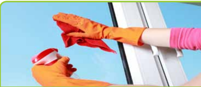
Textil- und Hausservice Arbeitstraining