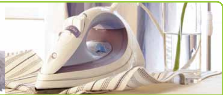
Textil- und Hausservice Arbeitstraining

Unser Arbeitstraining ist ein Angebot für Menschen mit psychosozialen oder psychischen Problemen, denen es alleine schwerfällt, am Arbeitsmarkt Fuß zu fassen. Reale Arbeitsaufträge von KundInnen bereiten sie gezielt auf den Wiedereinstieg ins Berufsleben vor.